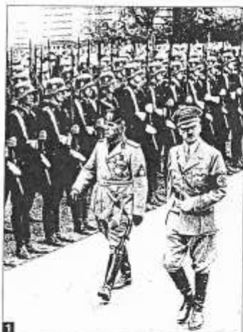
1 Hitler (à droite) et Mussolini (à gauche) passent leurs troupes en revue.

La France travaille à sa défense : les usines fabriquent des avions et des chars ; on construit des fortifications sur les frontières.