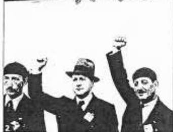
2 Le Front populaire : Léon Blum se trouve en haut, poing levé.