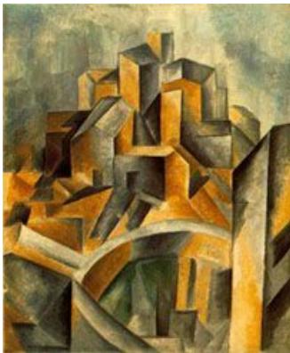
Réservoir Horta, 1909

Avec le cubisme, Picasso cherche à s'éloigner de la perspective traditionnelle et des signaux de l'espace. Il utilise des couleurs très vives, des arêtes dures, des espaces plats.