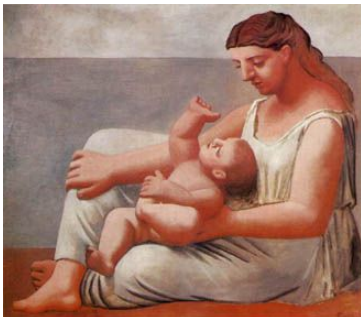
Mère et enfant en bord de mer, 1921

Picasso returns to a more classical way of painting: