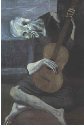
Le vieux guitariste - 1904

Picasso habite à Paris ; il a des problèmes financiers et son meilleur ami est mort. Il choisit des couleurs et des personnages qui reflètent son état d'esprit du moment.