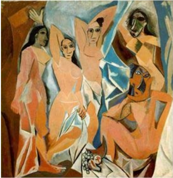
Les demoiselles d'Avignon, 1907.

Le terme « cubisme » est né d'un critique qui a dit que les peintures étaient « un amoncellement de petits cubes ».