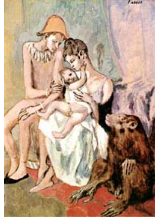
Acrobates de cirques 1905

Sa vie s'améliore, il est amoureux de Fernande, les couleurs et les sujets de ses peintures changent.