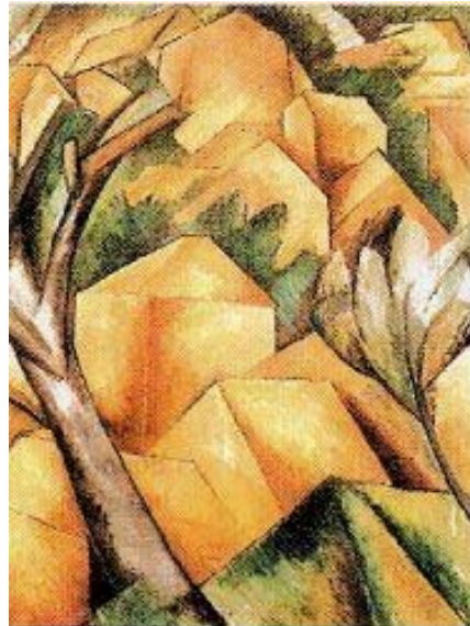
Maisons à l'Estaque, 1908

In this painting, Picasso depicts human figures by making use of several viewpoints, which became one of the characteristic features of cubism.