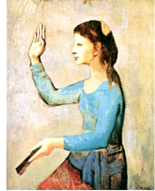
Fille à l'éventail, 1905