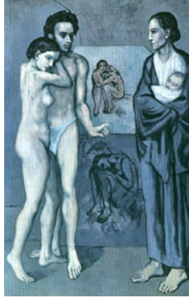
La vie - 1903