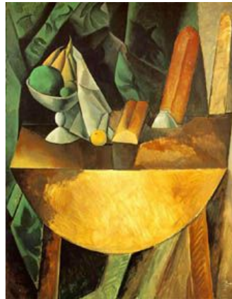
Pain, fruits et table, 1908

Avec le cubisme, Picasso cherche à s'éloigner de la perspective traditionnelle et des signaux de l'espace. Il utilise des couleurs très vives, des arêtes dures, des espaces plats.