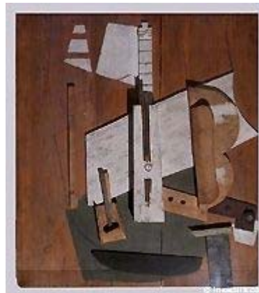
Guitare et bouteille de Bass , 1913, Musée Picasso, Paris