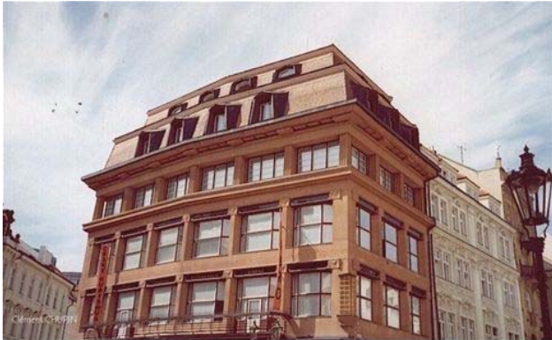
Prague – Grand Magasin « à la Madone noire » de la place Ovocný trh - J Gočár - 1911-1912