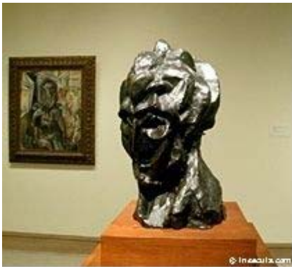
Le buste en bronze Tête de Femme, (Fernande) 1909, Musée national d'Art moderne, Paris.