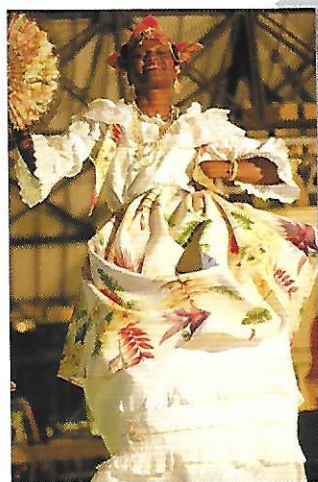
Le bèlè est un art de la parole, du rythme, de la musique et de la danse qui relie les descendants des esclaves à leurs origines africaines.

La Martinique est une île où les colons ont fait venir de nombreux Africains pour travailler comme esclaves dans leurs plantations. Ces Africains déracinés y sont arrivés avec leurs propres cultures qui, au fil du temps, au contact d'autres influences, ont évolué, donnant naissance à de nouvelles formes artistiques.