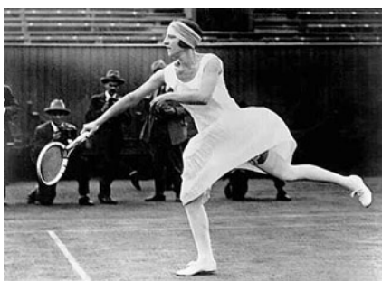
A Wimbledon, le 29 juin 1925

Savais-tu que :- Durant la Première Guerre Mondiale, elle poursuit son entraînement avec ses amis ou des officiers de retour du front. Les partenaires masculins sont nombreux, ce qui lui permet de s'endurcir physiquement comme techniquement.