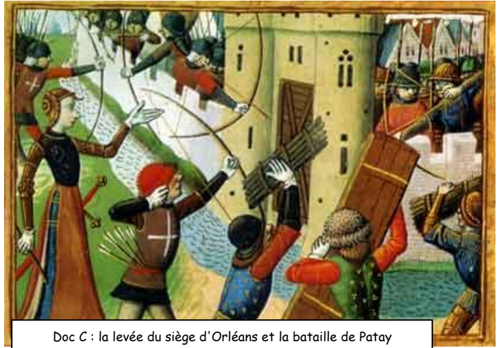
Doc C : la levée du siège d'Orléans et la bataille de Patay

Lorsque les Anglais viennent mettre le siège devant Orléans , tout semble perdu pour la maison de France. A Chinon, où il s'est réfugié, le futur Charles VII reçoit en audience une jeune paysanne de seize ans qui lui annonce que Dieu le reconnaît comme seul héritier légitime de la Couronne, et qu'il faut sauver Orléans . Jeanne d'Arc est le miracle que le parti Français n'espérait plus. Un souffle nouveau s'empare de l' armée française , qui libère Orléans et écrase les troupes anglaises à la bataille de Patay en 1429 , avant d'escorter Charles jusqu'à Reims où il est couronné. Dès lors tout réussit à Charles VII . Il fait la paix avec le duc de Bourgogne ( traité d'Arras , 1435) et reprend tous les territoires de France aux Anglais , à l'exception de Calais . La Guerre de Cent Ans est alors terminée.