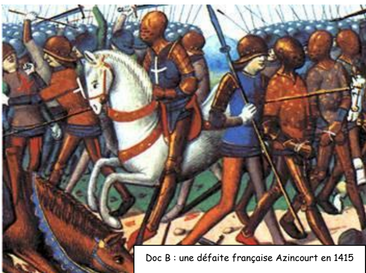
Doc B : une défaite française Azincourt en 1415