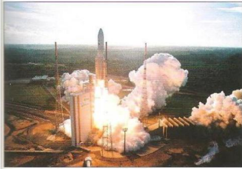
Kourou, un site de haute technologie en Guyane