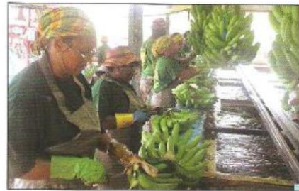
Activité dans une plantation de bananes en Martinique

En Martinique et en Guadeloupe, la banane est la principale production de l'agriculture. La banane est vitale pour les économies de la Martinique et de la Guadeloupe. Elle fait vivre plus de 10 000 personnes dans ces deux îles. La banane est cultivée dans de grandes plantations qui utilisent des méthodes modernes. C'est une culture d'exportation c'est-à-dire qu'on cultive essentiellement pour vendre à l'étranger. Les fruits sont soigneusement préparés, mis dans des cartons et envoyés vers la métropole. Ensuite, ils sont parfois réexportés vers d'autres pays comme l'Allemagne et l'Espagne. Cette agriculture de plantation nécessite cependant la présence d'hommes et de femmes chargés de la récolte, de la préparation des fruits et du conditionnement. Mais ces agriculteurs ne parviennent pas forcément à vivre correctement de leur travail. L'Union européenne leur accorde donc des subventions.