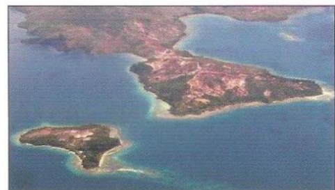
Une mine en Nouvelle-Calédonie

La Nouvelle-Calédonie a toujours été une région riche en minéraux. Dès le 19 e siècle, l'or a attiré toutes les attentions puis on a exploité le cuivre. Aujourd'hui, c'est le nickel qui apporte le plus de richesses mais on exploite aussi le charbon, le fer, le cobalt. C'est ce qui explique que beaucoup d'habitants de Nouvelle-Calédonie sont mineurs ou descendants de mineurs. L'activité minière fait encore vivre une grande partie de la population mais elle n'est pas sans inconvénients. Les grandes mines à ciel ouvert contribuent à dégrader la végétation. Les terres sont mises à nu et subissent une érosion intense. Heureusement, la réglementation oblige aujourd'hui à traiter correctement les déchets des exploitations et à replanter de la végétation.