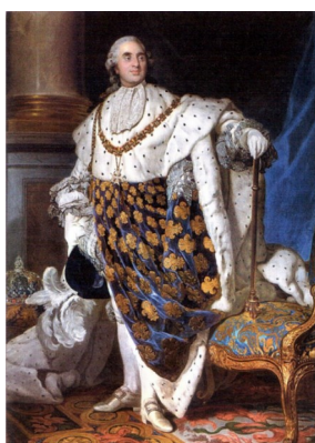
Portrait de Louis XVI Joseph-Siffred Duplessis, Louis XVI en costume de sacre, 1777, musée Carnavalet.

Qui est le « Nous » cité par Louis XVI ?