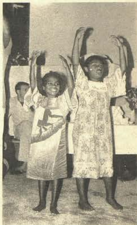
Célébration à Mare

Ua tamata te hoê taata teretetiano tuiroo farani i te tuatapapa e na hea ra o ia e ite ai i to te Varua Moà oraa i roto ia na, i roto i to na oraraa. Ua papai o ia i ta na pahonoraa i nià i te hoê âpi