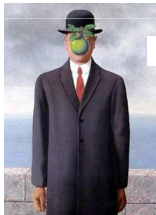
René Magritte, Le fils de l'homme, 1964