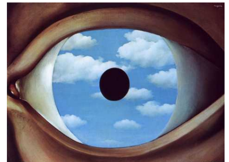
René Magritte, The False Mirror, 1928