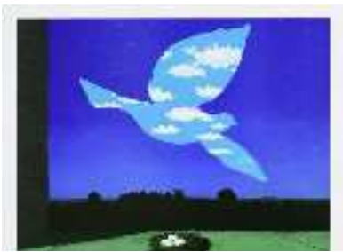
René Magritte, Le retour, 1940 Lithographie

Dans le Paris de l'après-guerre (1918), un groupe d'artistes et d'écrivains, sous la direction du poète André Breton, engendre d'étranges œuvres imaginaires. En rébellion contre le monde quotidien rationnel, ils tirent leur inspiration de leurs rêves et de leur imagination dans le but de créer une réalité nouvelle, une «surréalité». Le surréalisme se caractérise par une imagerie du bizarre et du surréel. Pour créer ce climat d'étrangeté, les surréalistes aiment bien associer des objets insolites, et trouvent de la beauté et de la poésie dans des images inattendues.