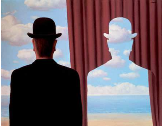
René Magritte, Decalomania, 1966