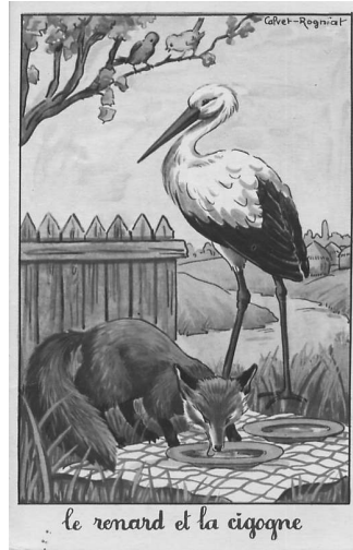
le renard et la cigogne

(Fables, de Jean de la Fontaine - 17ème siècle)