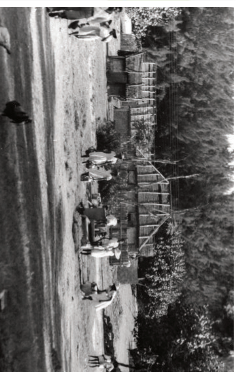
Saint-Paul, Saline-les-Bains : groupe de femmes s'approvisionnant en eau à la fontaine publique. 4La Réunion, n. et b., 9 x 14 cm (1955-1960)