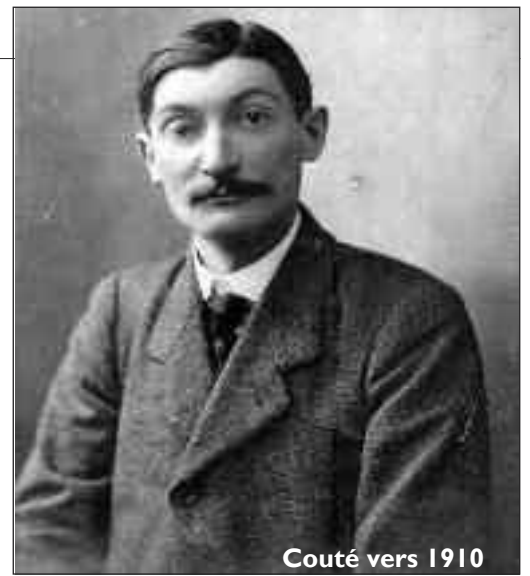
Couté vers 1910

NON CONTENT , de lécher, avec gourmandise, les bottines de Poutine, un grand démocrate selon lui, Depardieu s'en prend désormais à l'opposition russe et aux Pussy Riot. « Je tombe de scooter, mais je suis un homme vivant », a-t-il conclu, entre deux rots. La seconde de ces assertions nous paraît cependant de plus en plus douteuse.