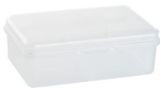
4 boîtes en plastique transparent