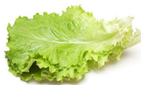
feuilles de salade un peu flétrie