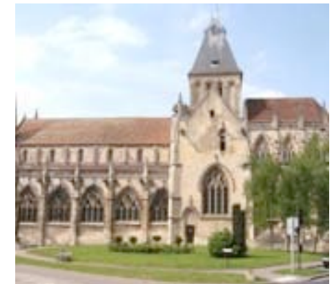
église Saint-Gervais & Saint-Protais #