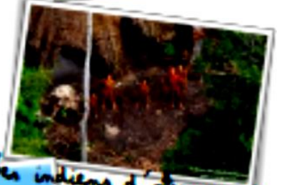
Les indiens d'Amazonie