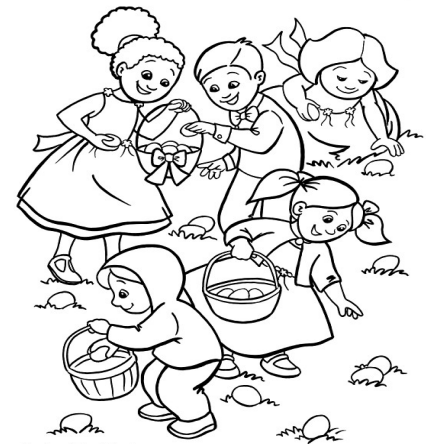
Easter Egg Hunt Illustrated by: Leanne Franson

De petits oeufs en chocolat sont cachés. Les enfants doivent les trouver pendant une grande chasse aux oeufs. Maintenant on peut même ramasser des lapins de Pâques.