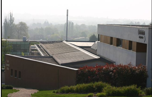
Ecole maternelle et crèche de Brindas

Une antenne relais de dernière génération a été installée pendant les vacances scolaires de février par l'opérateur ORANGE, sur un terrain privé dans la zone industrielle des Andrés. Il n'y a pas eu d'information ni de concertation auprès des Brindasiens quant à la mise en place de cette antenne relais.