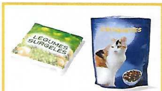
Emballages non aluminisés et non craquants