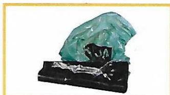
Sacs poubelles vides