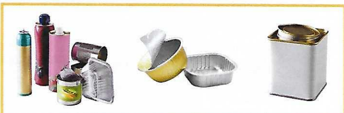
Aluminium / métal