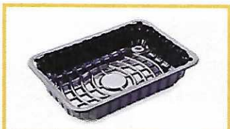
Barquettes de viande