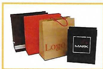
Sacs de boutique vides