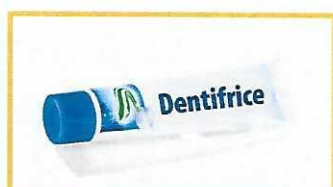
Hygiène / cosmétique