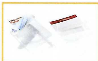
Barquettes charcuterie pâtes fraîches