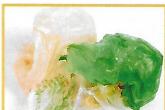
Sacs de caisse vides