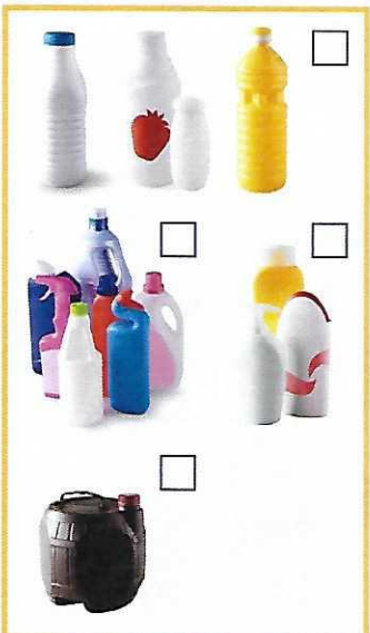
Bouteilles en plastique