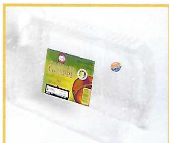
Barquettes fruits / légumes