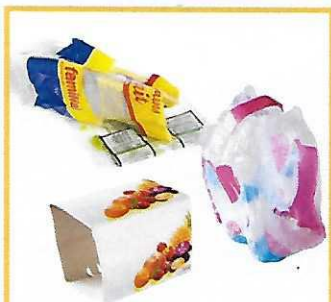
Emballages de regroupement