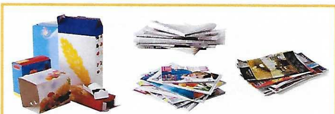
Cartons / papiers