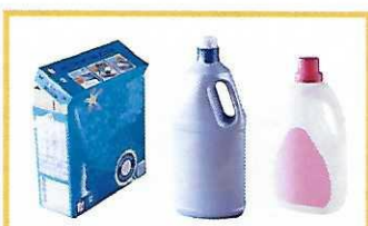
Boîtes de lessive