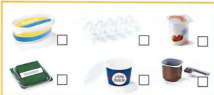
Emballages produits frais