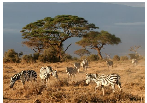
Photo dans son milieu de vie