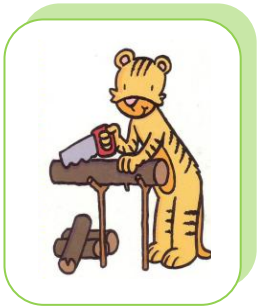
Tigrou scie du bois.

Souligne le mot qui précise l'action qui se déroule sur les images.