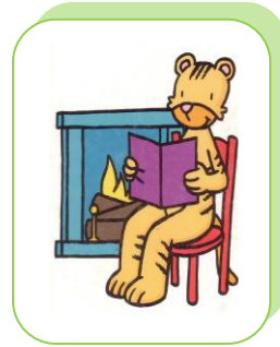
Il lit un livre devant la cheminée.