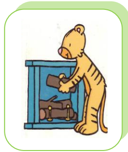
Il prépare le feu.