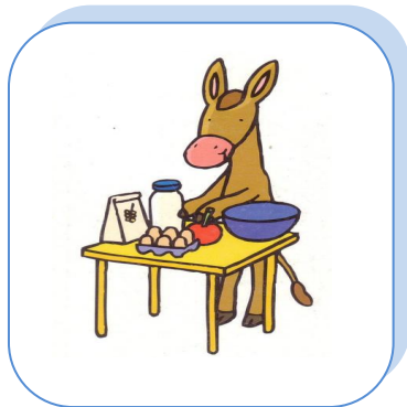
Carl ..... les ingrédients.