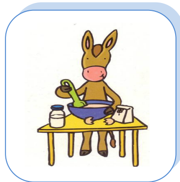
Il ..... la pâte.