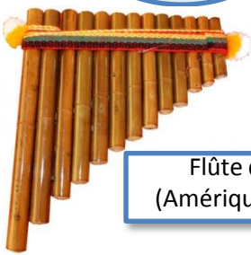
Flûte de Pan (Amérique du Sud)