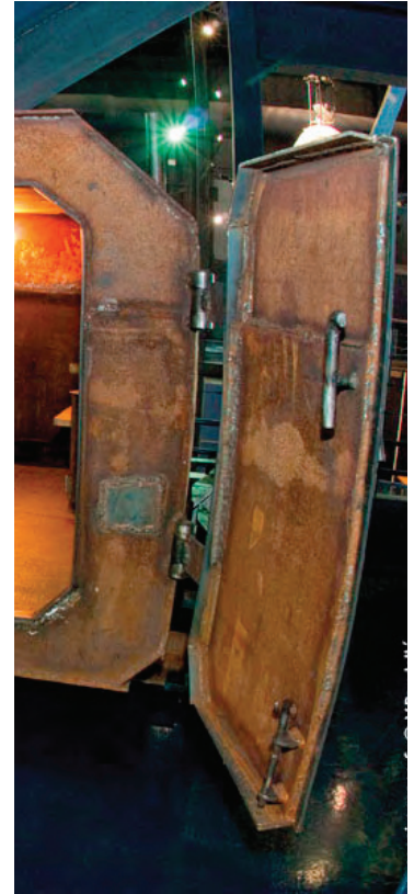
Vodstok / Installation sonore – cabine d'écoute / 2011

Unendliche : Mot allemand qui veut dire : infini.