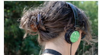
Photos 1 / 2 / 3 / captures d'écran de la démo de Audio room l'Appli. Photo 4 / d'Eddie Ladoire.