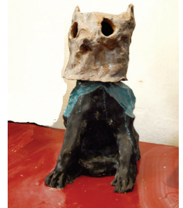
1/ Huile sur toile. 2/ et 3/ Céramique