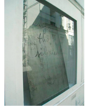
Photos 1 / 2 / d'Eddie Ladoire, différents lieux de prise de son . Photo 3 / Feuille d'acier de 5mm d'épaisseur + découpe laser, 140 cm x 90 cm / Exposition optical sound / Galerie Frédéric Giroux / Paris

Son du dehors, de la forêt qui est maintenant dedans et qui s'installe le temps de l'écoute, 15 minutes. À travers cette pièce créée pour la chapelle Saint-Loup, Eddie Ladoire nous propose des ambiances que nous découvrons dans cet art du temps. Le langage d'Eddie Ladoire suscite immédiatement notre écoute, réclamant un investissement plus grand que celui de notre regard. Il crée une fiction, Inside deep forest , composée de différents temps, de matières, de déplacements dans un paysage sonore.