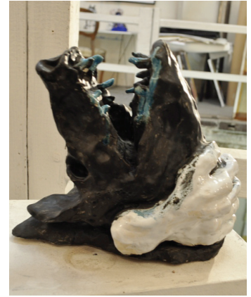
1/ Trouver, se perdre / charbon de bois / 2018. 2 / Vagues lueurs d'améthyste / huile sur toile / 2018. 3 / Gravure / 2018 . 4 / Céramique / 2018 .

Dans chacune de ses oeuvres c'est un bouleversement où le geste brutal et la virtuosité se côtoient. Ainsi, le modelé des figures, inspiré par une facture classique, rencontre la coulure ou l'empreinte. Ailleurs la vivacité d'un trait intercepte les fins glacis.