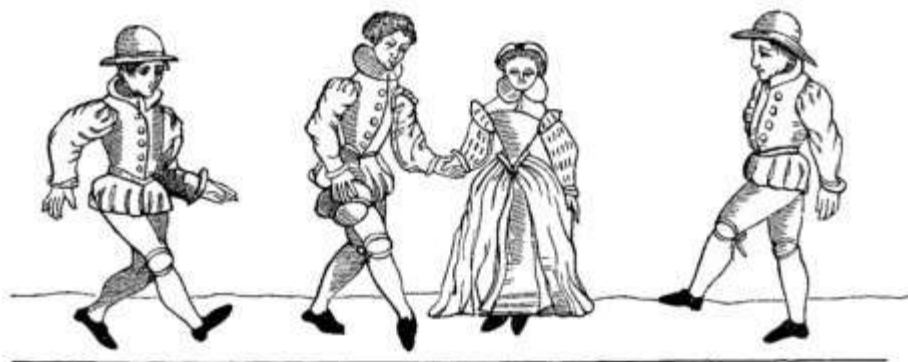
Fig. 187 —The Dance called "La Gaillarde."—Fac-simile of Wood Engravings from the "Orchésographie" of Thoinot Arbeau (Jehan Tabourot): 4to (Langres, 1588).