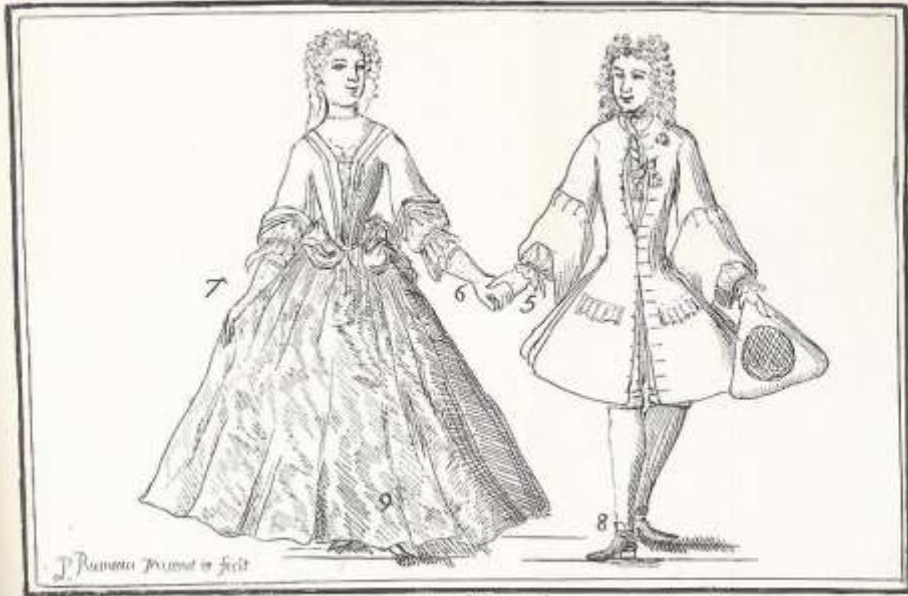
Homme et Femme prest a faire la premier Reverence avant de Dancer