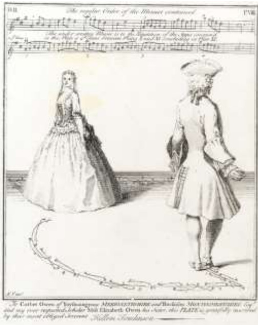
The regular Order of the Minuet continued