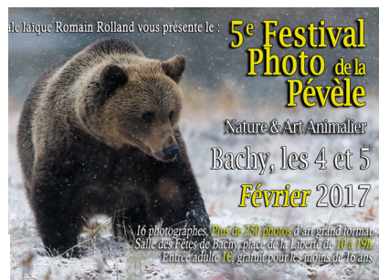
5e Festival Photo de la Pèvèle BACHY Samedi 4 et dimanche 5 février p. 6