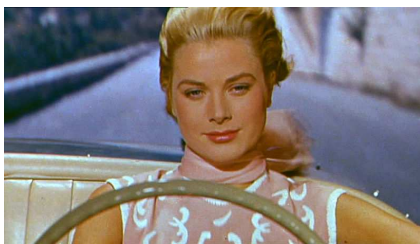
Grace Kelly dans La main au collet , 1955