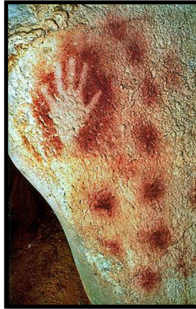
Grotte de Pech Merle, Lot, France