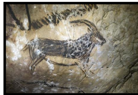
Grotte de Niaux, Ariège, France