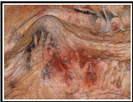
Grotte de Gargas, Haute Pyrénées, France