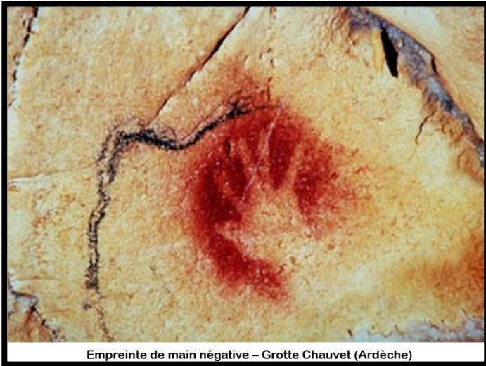
Empreinte de main négative – Grotte Chauvet (Ardèche)