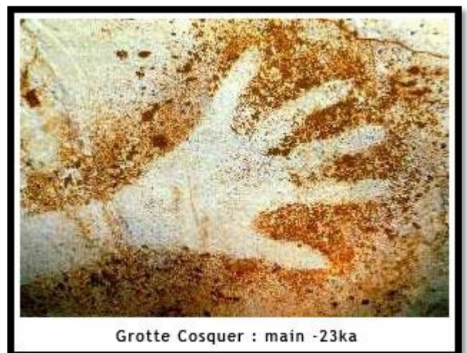
Grotte Cosquer : main -23ka