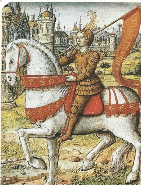
Jeanne d'Arc. Miniature, XVI e siècle.

En 1431, elle est prise par les Anglais et jugée par l'Eglise qui la fait brûler.