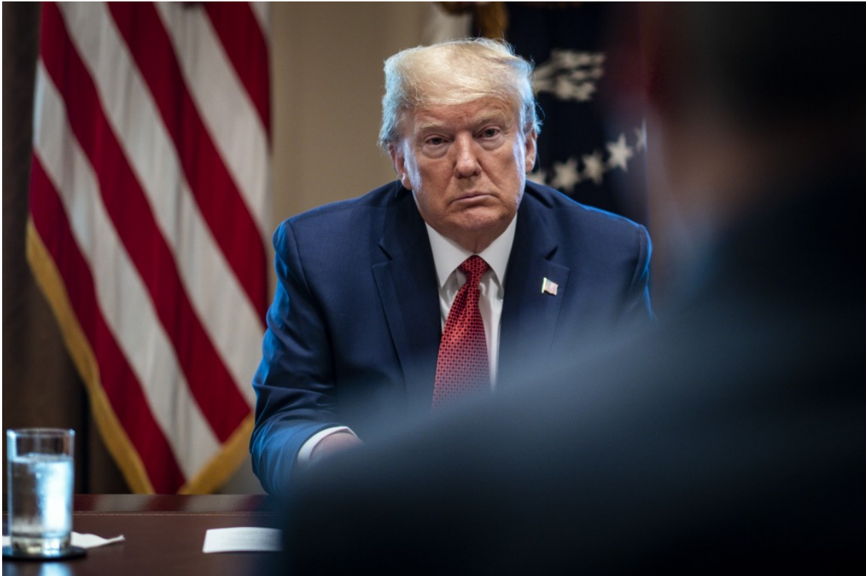
Donald Trump à la Maison blanche, le 29 mars 2020

Lorsque l'on sait que la Californie et ses 40 millions d'habitants sont le premier contributeur au PIB US, le locataire de la maison Blanche ne doit plus dormir tranquillement sur ses deux oreilles... L'Armée US sait bien qu'elle ne pourra rien faire contre un peuple en armes !