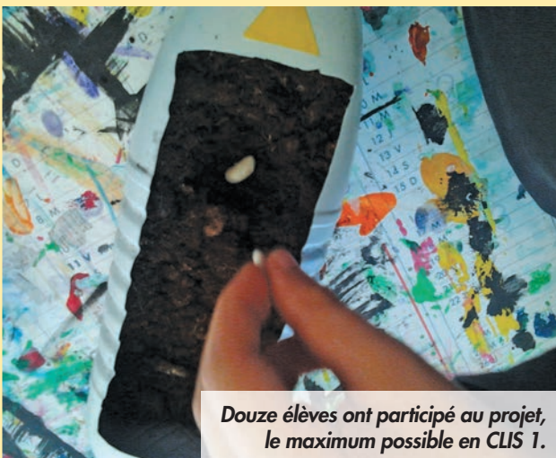
Douze élèves ont participé au projet, le maximum possible en CLIS 1.

►► chat et Harry Souris, nous sommes partis dehors à la recherche de graines, au du moins de ce que les élèves pensaient être des graines. »