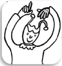
TABLEAU D'ENCODAGE LE SON *in/im/ain/ein