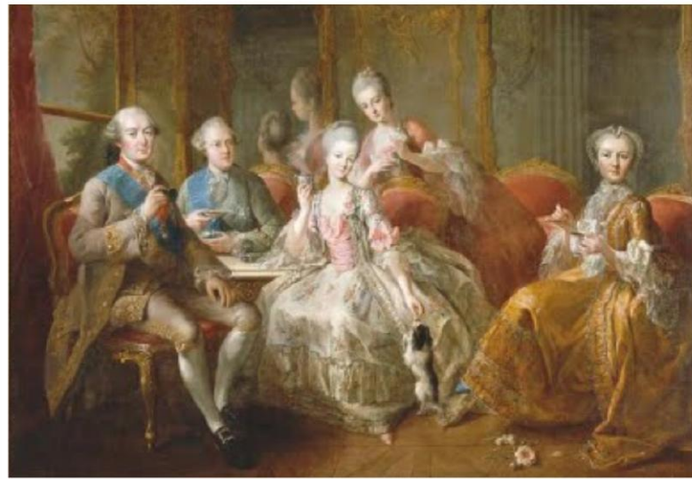
La tasse de chocolat, JB Charpentier, 1768

Charles Loyseau (1566-1627) était un juriste. Nous ne pourrions vivre ensemble si nous étions tous égaux. Il faut nécessairement que les uns commandent et que les autres obéissent. Les souverains commandent à tous, les grands commandent aux médiocres, les médiocres aux petits, les petits au peuple. Et le peuple obéit à tous. Les uns se consacrent au service de Dieu, les autres à protéger l'État par les armes, les autres à les nourrir. Ce sont les trois ordres. Dans le tiers état, qui est le plus grand, on trouve des gens de lettres, des financiers, des marchands, des laboureurs et des ouvriers.