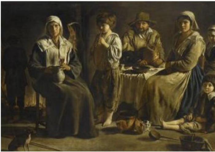
Famille de paysans dans un intérieur, Louis Le Nain, 1648