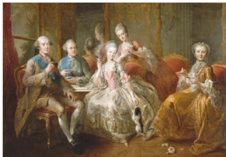
La tasse de chocolat, JB Charpentier, 1768

Charles Loyseau (1566-1627) était un juriste. Nous ne pourrions vivre ensemble si nous étions tous égaux. Il faut nécessairement que les uns commandent et que les autres obéissent. Les souverains commandent à tous, les grands commandent aux médiocres, les médiocres aux petits, les petits au peuple. Et le peuple obéit à tous. Les uns se consacrent au service de Dieu, les autres à protéger l'État par les armes, les autres à les nourrir. Ce sont les trois ordres. Dans le tiers état, qui est le plus grand, on trouve des gens de lettres, des financiers, des marchands, des laboureurs et des ouvriers.