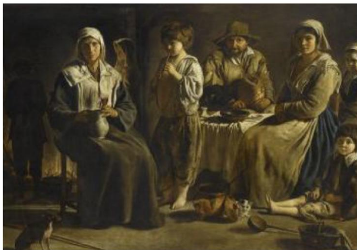
Famille de paysans dans un intérieur, Louis Le Nain, 1648