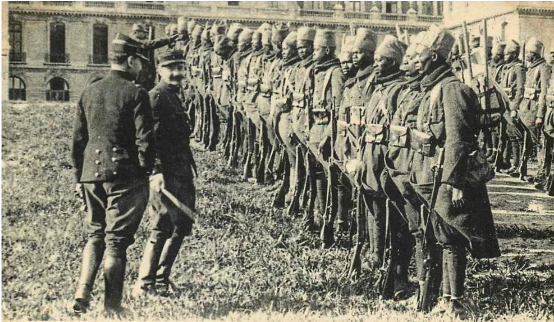
Guerre 1914-15... Tirailleurs Sénégalais Revue du Capitaine