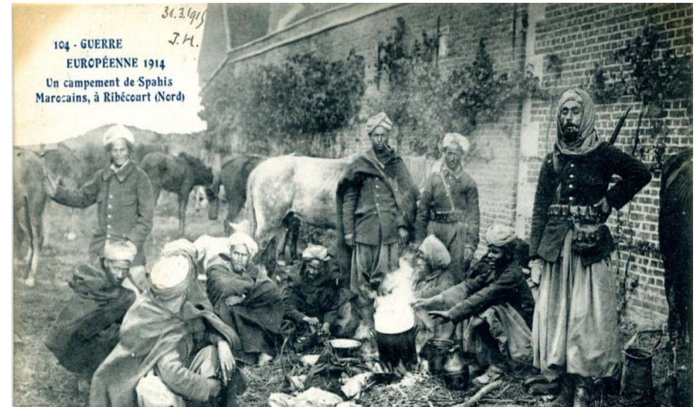
104 - GUERRE EUROPÉENNE 1914 Un campement de Spahis Marocains, à Ribécourt (Nord)