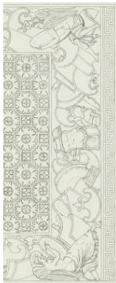
Les frises d'armes et les victoires ailées en périphérie du décor des arcades latérales. Dessin de Narcisse Brunette.

Compte tenu de l'état du monument, les décors sont difficilement lisibles.