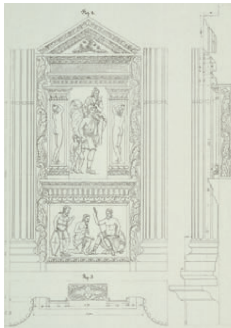
Au niveau de la face nord, 2 e piédroit en partant de l'ouest, plusieurs spécialistes ont identifié la représentation d'Enée portant son père Anchise sur ses épaules et tenant son jeune fils Ascagne par la main. Dessin de Narcisse Brunette.