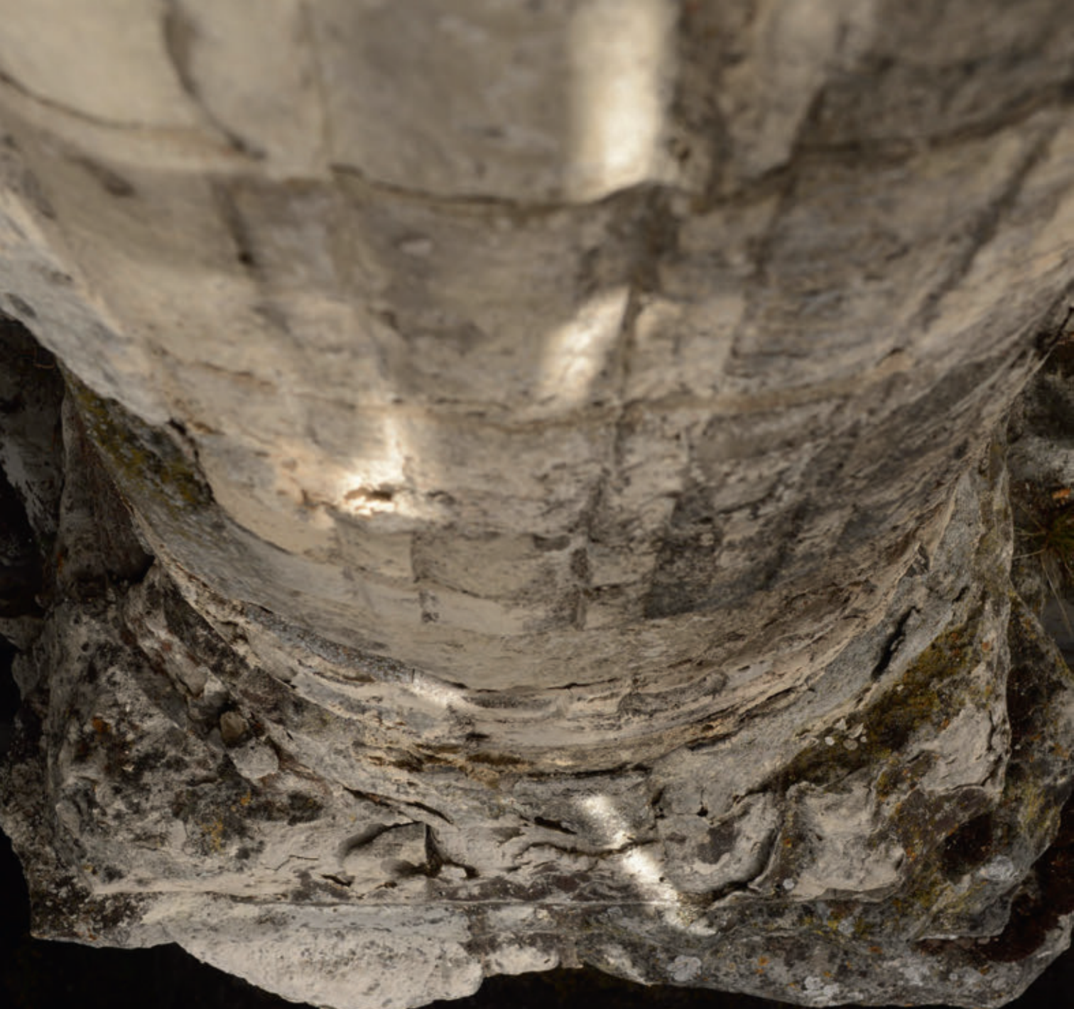
Le chantier de 2015 permet de mesurer l'état de dégradation de la pierre