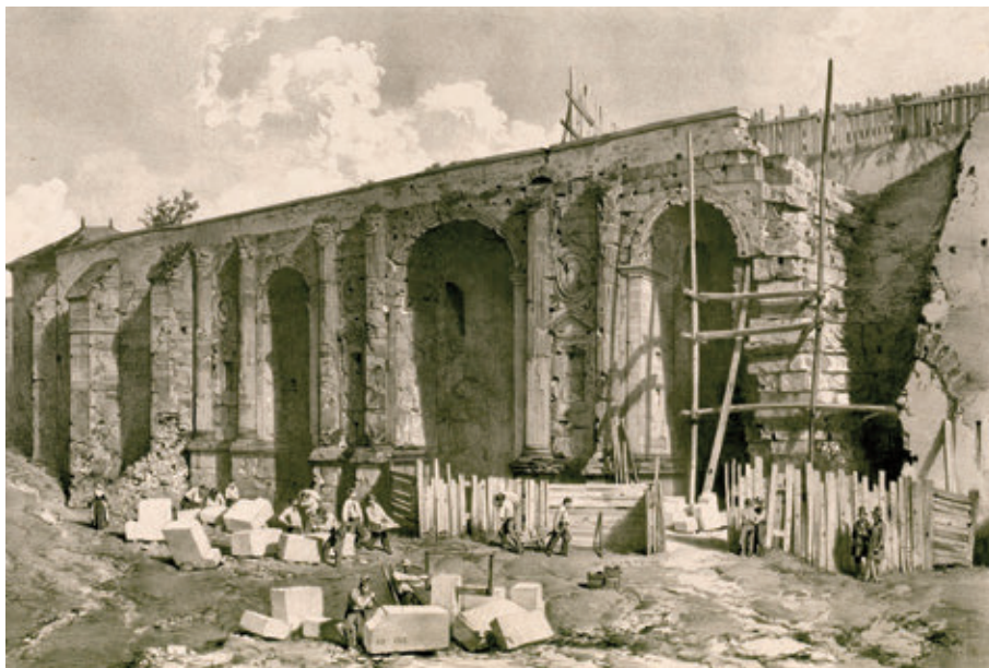
En comparant ces deux images, on remarque tout à droite la recréation du piédroit ouest par Narcisse Brunette. Lithographies Adrien Dauzats. © Reims, Bibliothèque Municipale, FIC, XXX I 4 52 et FIC, XXX I 3 08