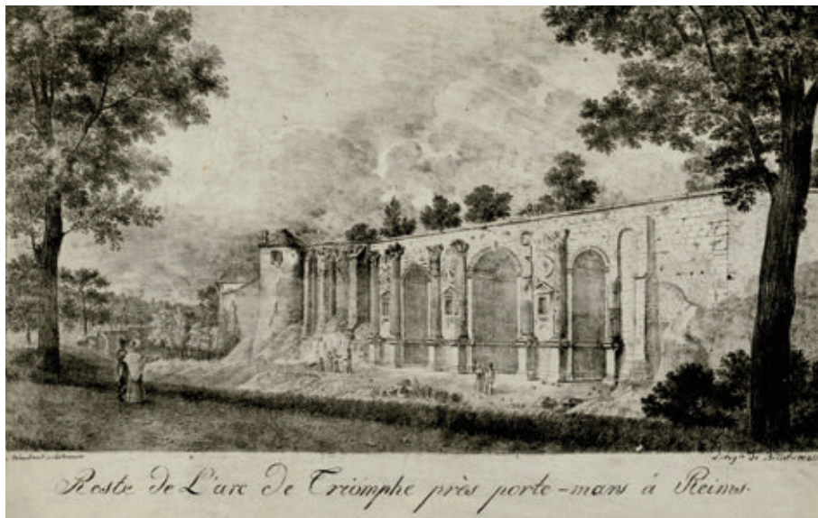
Sur cette gravure on voit la porte de Mars insérée dans les remparts.

Au IV e siècle, la ville se réorganise avec un nouveau plan urbain dont la réalisation la plus importante est la construction d'un rempart qui va relier les arcs monumentaux entre eux, délimitant ainsi une enceinte de 60 ha. L'ampleur des travaux, la monumentalité de la construction ne témoignent pas d'une période d'insécurité mais d'un renouveau de la ville.