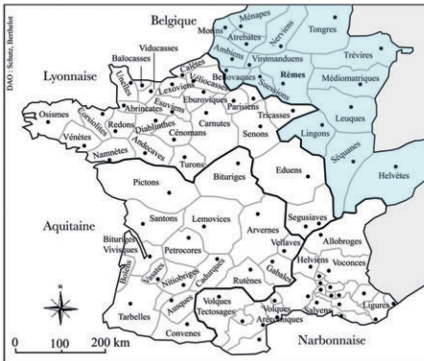
Carte des cités et des provinces de la Gaule au Haut-Empire © D'après Argentomagus, un nouveau regard sur la ville antique, 2002

Ce nouveau statut entraîne une transformation de grande ampleur. Une nouvelle ville est dessinée, s'étendant sur 600 ha, et délimitée par une enceinte. Cette superficie semble démesurée pour une ville gallo-romaine mais les nombreuses fouilles archéologiques prouvent qu'au moins 450 ha ont été occupés. Durocortorum devient ainsi la plus grande ville de la Gaule romaine et se place parmi les plus importantes de l'empire romain.