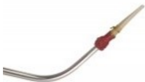
la flute à bec