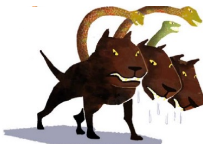
Cerbère , le chien à trois têtes, monstrueux gardien des Enfers.

- Je vais l'envoyer aux Enfers ! C'est le pays des morts. On n'en revient jamais ! Car un monstre terrifiant, Cerbère, garde l'entrée des Enfers.