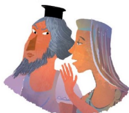
Hadès et Corè. le roi et la reine des Enfers.

Aux Enfers, règnent Hadès et son épouse Corè. Avant de s'attaquer à Cerbère, Hercule doit obtenir leur autorisation.