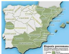
Siglo III a.C. íberos y celtas