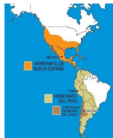
siglos XV- XIX : colonias americanas (imperio español)

> Mémoriser ce qui est surligné et savoir remettre les grandes périodes dans l'ordre chronologique. Savoir placer les 3 grandes civilisations (maya, azteca, inca) sur una carte.