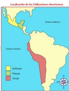
Antes del siglo XV : América precolombina