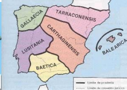
Siglos III a.C. - V d.C hispania romana