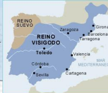
Siglos V-VIII visigodos