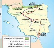
Siglo VIII invasión árabe