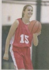
claro (Évidemment) = por supuesto

"Me gusta salir con mis amigos y me gustan los deportes, sobre todo el baloncesto. Juego en un equipo desde que tenía 9 años. También me gustan las películas y las series de ciencia ficción, pero prefiero verlas en casa y en versión original. Y claro, como a todo el mundo, me gusta navegar por internet, sobre todo para ver vídeos. No me gusta mucho ir a discotecas, prefiero los sitios más tranquilos, pero a veces voy con mis amigos a bailar un rato. También me gusta mucho el monte, ir de acampada y esquiar."