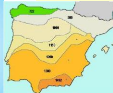
Siglos VIII - XV Reconquista