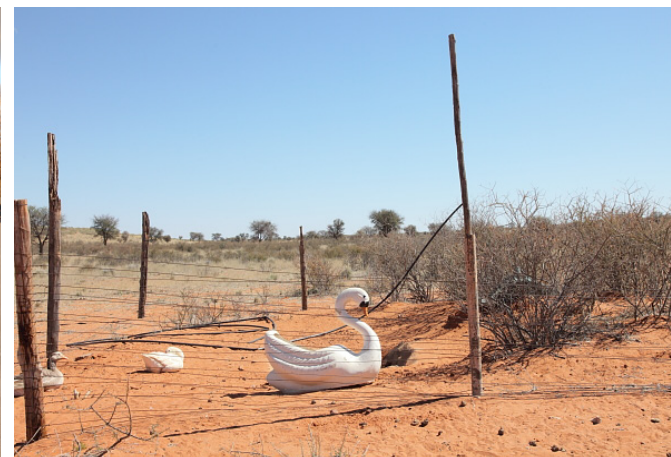
3/ Witdraai, Kalahari, South Africa, 2012