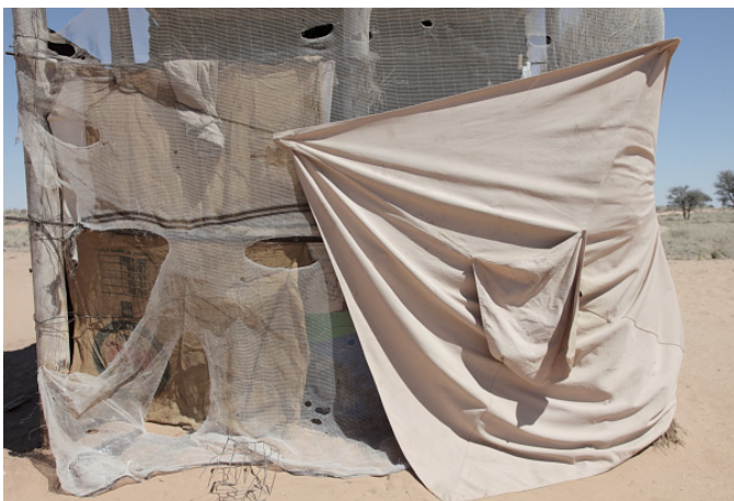
1/ Witdraai, Kalahari, South Africa, 2012

Lien Botha a imaginé des dispositifs différents dans plusieurs sites pour la manifestation Les revenants. Durant sa première résidence artistique lors de l'été 2014, elle était notamment à la recherche d'indices visibles à Bordeaux et sur le territoire girondin du passage des Hollandais au 17ème siècle. Lien Botha interroge l'histoire, sonde son écho toujours changeant. L'artiste Sud africaine révèle par petites touches sensibles combien nos sociétés sont construites de flux et de reflux d'influences mutuelles.