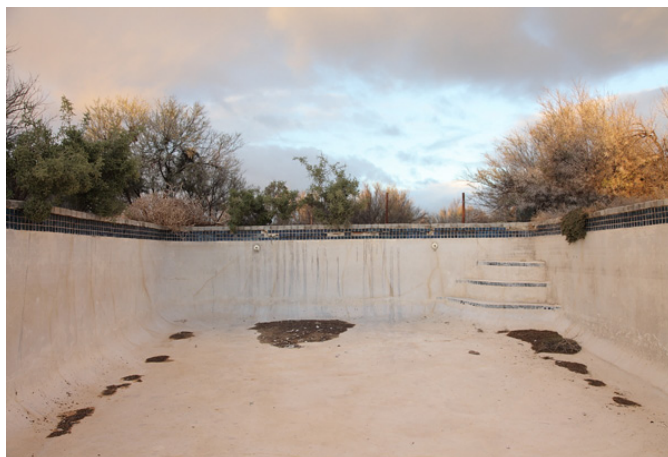
2/ Swimming Pool, Tankwa-Karoo, South Africa, July 2013