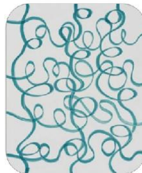
CAETANO DE ALMEIDA Artiste brésilien