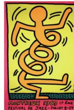
Keith Haring, 1983.