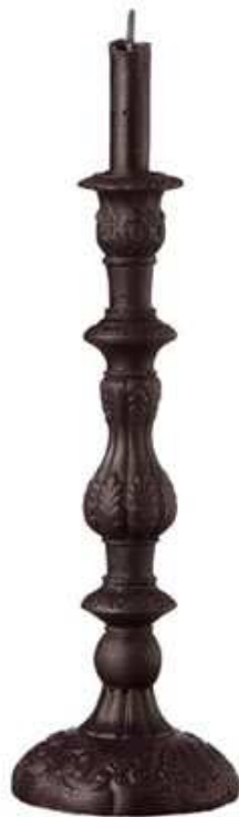
Bougie noire et bougeoir noir

Le tout étant sous le fameux Pentagramme.