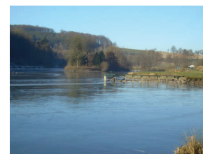
Etangs de la Strange à Hompré