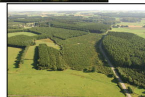
PAE de Villeroux et de Nives