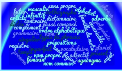
Vocabulaire : ordre alphabétique