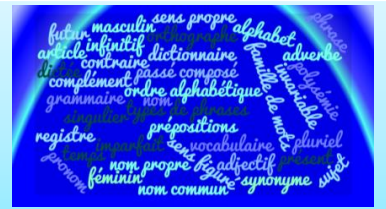
Grammaire : le verbe, verbe et infinitif