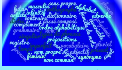
Vocabulaire : ordre alphabétique