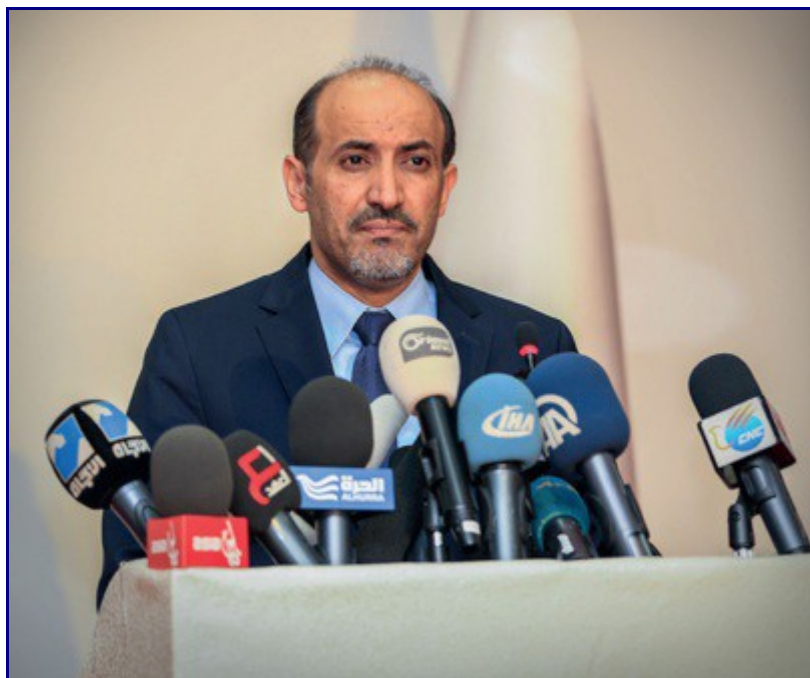
[Légende originale:] L'apostat et ancien chef du Conseil National Syrien

L'un des pires aspects de ces théories est qu'elle ne réclament aucune preuve, mais seulement des « déductions » stupides. Et ce qui est encore pire, la plupart de ces théoriciens du complot sont eux-mêmes impliqués dans de véritables conspirations kāfir! Nous voyons les Sahwah irakiens [ ndt: des milices sunnites irakiennes financées par l'armée américaine ] qui se battent aux côtés de l'armée irakienne – et qui sont ouvertement soutenues par l'Iran – tout en prétendant que les mujāhidīn sont des agents de l'Iran! On peut voir les différentes factions Sahwah qui cèdent ouvertement des territoires au régime Nusayrī [ ndt: alaouite ], tout en prétendant que les mujāhidīn coopèrent avec le régime Nusayrī! On peut voir les différentes factions Sahwah qui discutent ouvertement et publiquement avec le Qatar, la Turquie, les Āl Salūl [ ndt: terme péjoratif pour la famille royale d'Arabie Saoudite ] et les américains pour préparer leurs plans de coopération contre l'État Islamique, tout en prétendant que les muhājirīn [ ndt: combattants chiites ] et ansār [ ndt: ansār-al-islam, un groupe salafiste qui a intégré l'État Islamique ] sont alliés et sont des agents de pays étrangers! On peut voir la Coalition Nationale Syrienne qui envisage de rencontrer le régime Nusayrī, tout en prétendant que l'État Islamique se bat dans l'intérêt de ce régime!