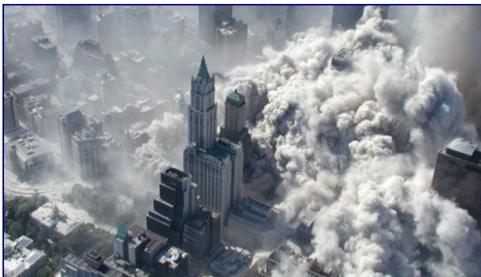
[Légende originale:] Le raid béni contre les tours jumelles à New York

Inquiet devant la multiplication des théories attribuant sa création et son financement aux puissances occidentales et à leurs alliés moyen-orientaux, l'État Islamique a décidé de contre-attaquer avec cet article, qui taxe d'« idolâtrie » les théories du complot et leurs adeptes.