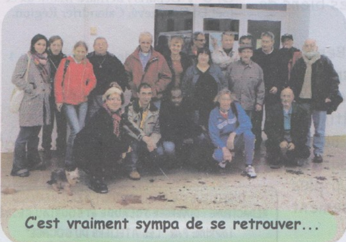
C'est vraiment sympa de se retrouver...