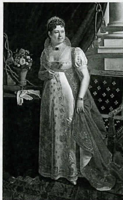
Château de Versailles.

En 1808, Napoléon crée la noblesse d'Empire : ses ministres accèdent au titre de comte, les meilleurs préfets deviennent barons, ducs ou chevaliers... des titres qui sentent l'Ancien Régime ! 3 200 personnes sont anoblies sous l'Empire : 59 % sont des militaires, 22 % des hauts fonctionnaires (préfets, magistrats), 17 % des notables (maires ou sénateurs). Beaucoup de Français estiment que Napoléon viole un des principes de la Révolution. Il argumente : la noblesse d'antan était une noblesse qui « n'avait même pas pris la peine de naître », cette nouvelle noblesse est largement ouverte au mérite et au talent, elle ne dispose pas de privilèges, hormis honorifiques. Cela ne convainc pas vraiment ! ●