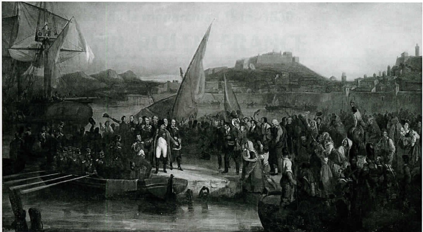
Château de Versailles.

Les souverains étrangers se coalisent une fois de plus contre lui. Malgré la victoire française de Ligny sur les troupes prussiennes, le général anglais Wellington bat les armées françaises à Waterloo en juin 1815. Pour la seconde fois, l'Empereur abdique le 22 juin 1815 et se rend aux Anglais. Napoléon est emprisonné et déporté par les Britanniques sur l'île Sainte-Hélène, au milieu de l'Atlantique. Malade, Napoléon y meurt le 5 mai 1821 ●