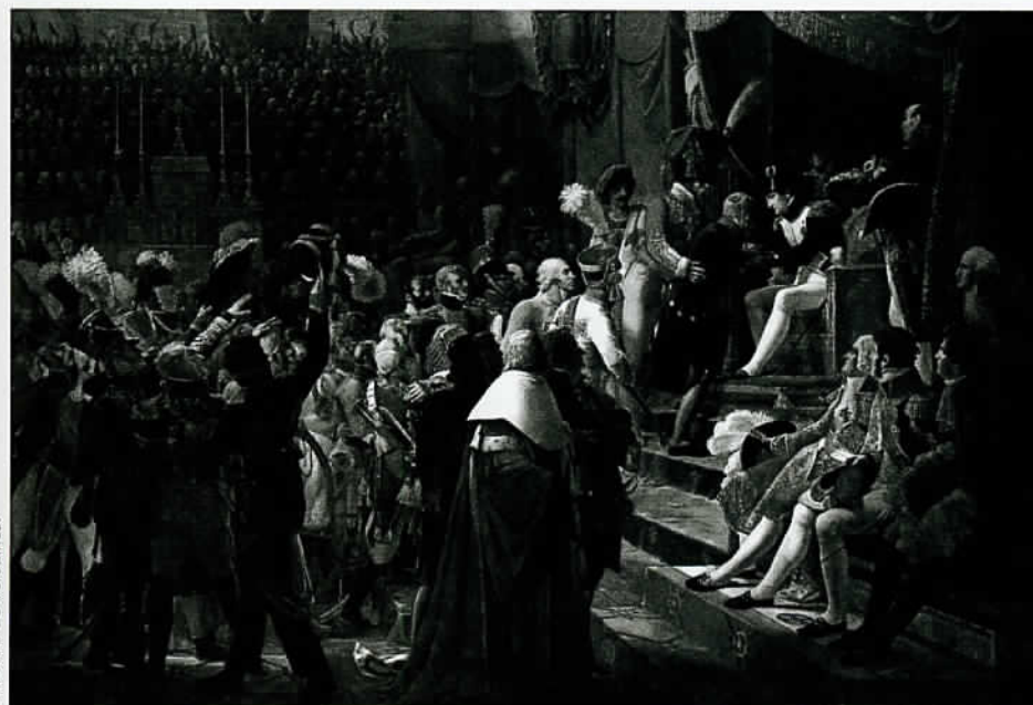
Première distribution des décorations de la Légion d'honneur en 1804. Peinture de J-B. Debret, 1812.

En 1802, des lycées sont créés dans chaque département. Dans une atmosphère quasi militaire, les fils des Français les plus aisés y apprennent le latin, le grec, le français et les mathématiques ; peu de philosophie et d'histoire, qui portent l'esprit à la critique ! Bonaparte désire trouver dans les lycées un vivier pour remplir les postes de son administration. Fermées en 1789, Napoléon réforme et rouvre les universités de droit, de médecine, de théologie, de sciences et de lettres, avec une organisation proche de celle d'aujourd'hui. En 1808, le baccalauréat est créé dans sa version moderne par Napoléon I er . La première année, il n'y a que 21 bacheliers. La création de la Légion d'honneur et des lycées s'inscrivent dans la même politique : former une élite dévouée à l'Empereur ●