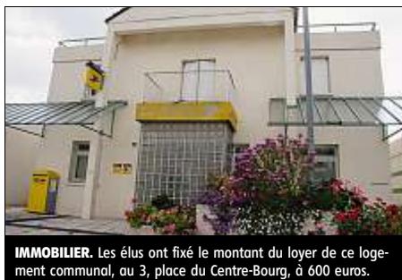
IMMOBILIER. Les élus ont fixé le montant du loyer de ce logement communal, au 3, place du Centre-Bourg, à 600 euros.