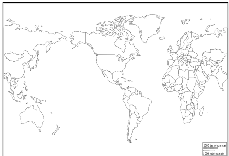
Un planisphère centré sur l'Amérique