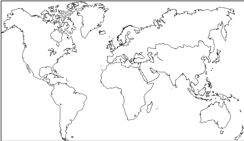
Un planisphère centré sur l'Europe

Un planisphère est une représentation à plat de notre planète. Il permet de voir l'ensemble de notre planète en un coup d'œil.