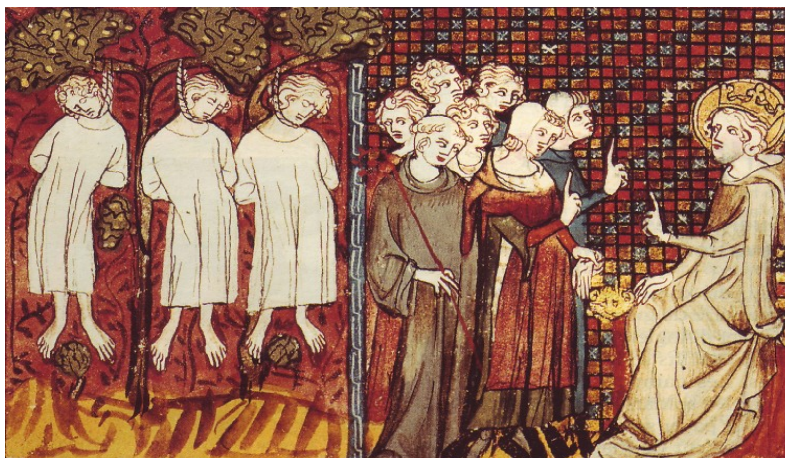
Saint Louis juge l'affaire du sire de Coucy