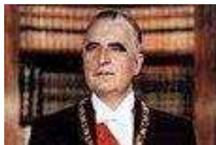
Valéry Giscard d'Estaing (1974-1981)