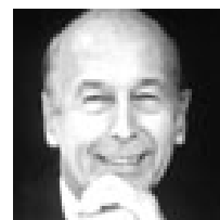
François Mitterrand (1981-1995)