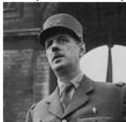
Georges Pompidou (1969-1974)