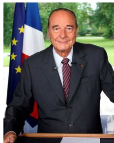
Nicolas Sarkozy (2007-2012)