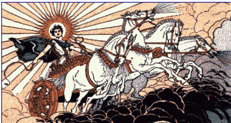
Hélios, le dieu du Soleil et son char