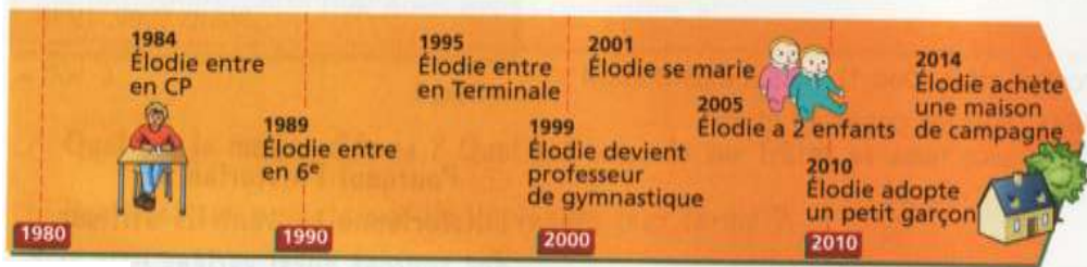
Doc. 2 : Frise chronologique moyenne : 30 ans de la vie d'Élodie.