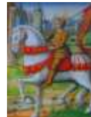
Jeanne d'Arc à cheval illustration d'un manuscrit 1505