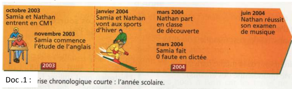
Doc .1 : frise chronologique courte : l'année scolaire.

Voici trois frises chronologiques. Lis et réponds aux questions.