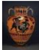
Amphore Grèce vers 500 av. J.C.