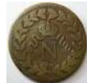
Décime pièce de monnaie sous Napoléon 1 er - 1815